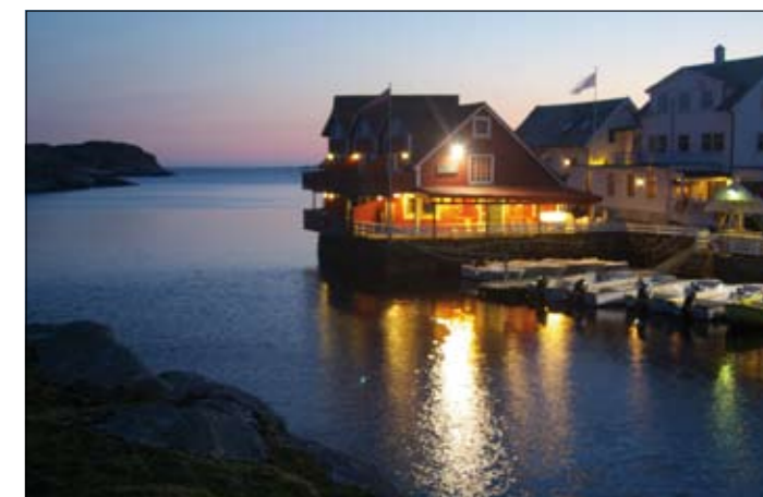
Het sfeervol direct aan het water gelegen visparadijs Nautnes Fiskevaer.

Het visparadijs Nautnes Fiskevaer ligt op ongeveer 90 autominuten rijden van Bergen, in het uiterste westen van Noorwegen. Met zo'n volle trailer was dat een aardig stukje rijden, maar om de beurt achter het stuur