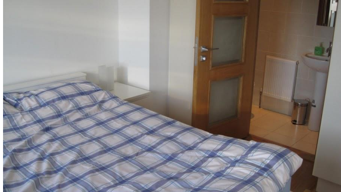
Rosses Point Guesthouse

Het verblijf in de regio Sligo is mogelijk in Rosses Point Guesthouse. Dit is een budget accommodatie die volledig nieuw is en voor sporters, surfers en vissers meer dan genoeg kwaliteit biedt. Er zijn verschillende soorten kamers beschikbaar tegen aantrekkelijke prijzen.