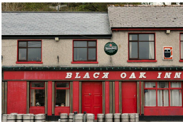
Black Oak Inn

pubs. Anchor House daarentegen is wat meer afgelegen, rustiger en heeft wat meer luxe en direct gelegen aan de Black Oak rivier en uitzicht op de haven.