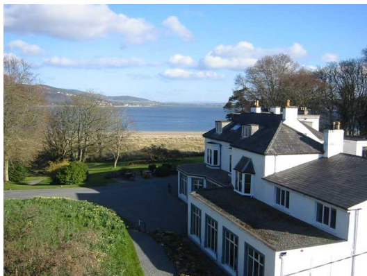
Fort Royal Hotel

Fort Royal Hotel: Dit is in deze regio wel een erg luxe optie om te verblijven. Maar daarbij is het wel van ongekeerde schoonheid. Direct aan de zee ligt het 15 kamers tellende 4 sterren Fort Royal Hotel. Van alle luxe voorzien zal het je hier aan niets ontbreken.