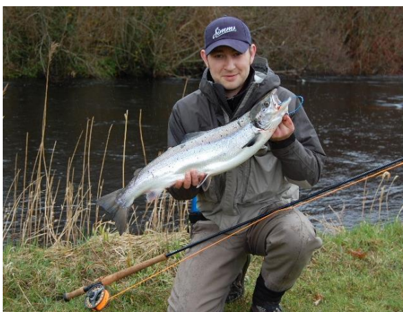
Drowes zalm op de vlieg