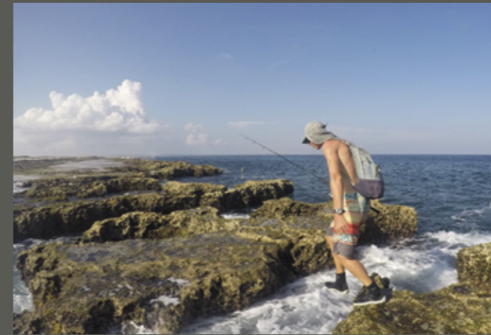
Peter kent het eiland op zijn duimpje.