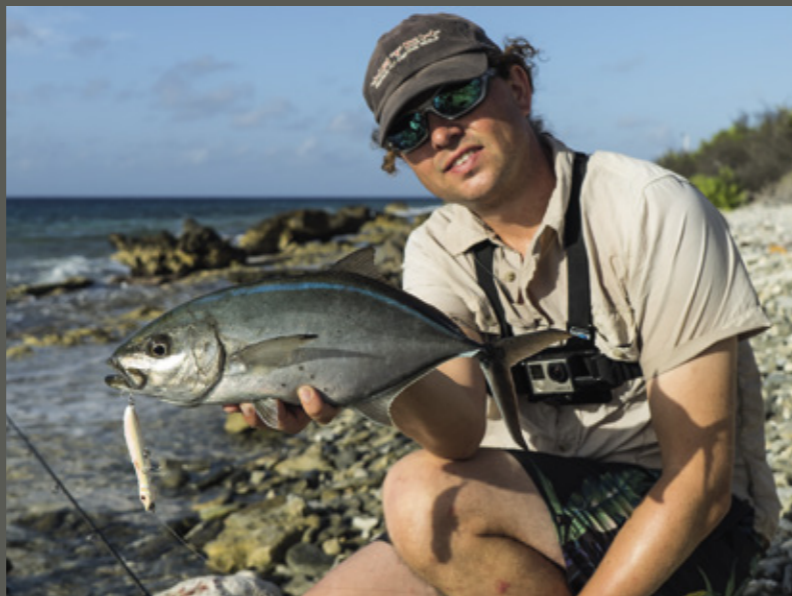
De bar jack: een fantastische sportvis!