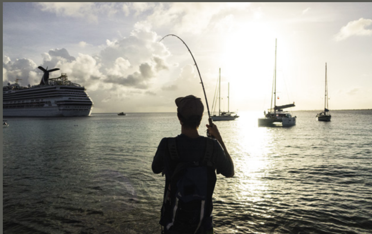
De Vistechnische Dienst zoekt het avontuur op in Bonaire

Het koraal komt er tegenwoordig in grote oppervlakken voor en het is van bijzonder goede kwaliteit. Deze riffen strekken zich uit tot enkele honderden meters van de kust. Vanaf daar duikt de zeebodem de diepte in, tot wel enkele honderden meters op relatief korte afstand van het eiland. De bodem van de diepe zee is gevarieerd. Er zijn vlakke en kale bodems te vinden, maar ook onderwaterbergen, riffen en steile drop offs.