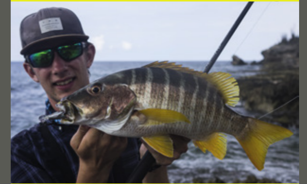
De schoolmaster snapper.