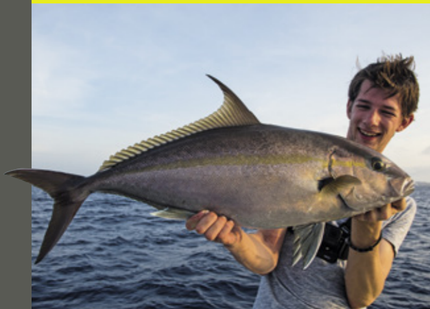
Een plaatje van een almaco jack!