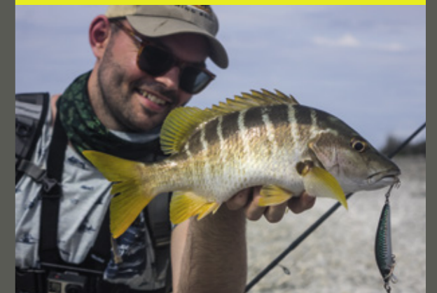
Ze genereren een ongekende kracht voor hun lengte.

Welkom in Mordor, met zijn vlijmscherpe rotsen en poelen vol zee-egels.