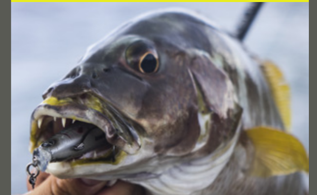
De pitbull van het rif. Check die tanden!