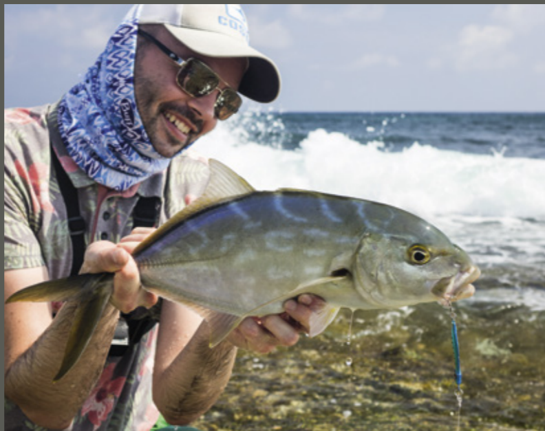
Je vangt ze vol in de branding, maar ook vanaf de rustige boulevard van Kralendijk.

met zee-egels. Je snapt dus wel dat de waterlijn bijna het gehele jaar ontoegankelijk is. Het is er gewoon levensgevaarlijk! We hebben deze kant van het eiland dan ook gekescherend Mordor genoemd, naar het 'Land van het Kwaad' uit de films van Lord Of The Rings.