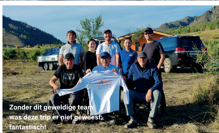
Zonder dit geweldige team was deze trip er niet geweest, fantastisch!

vis is geland en de topvis is binnen! Bijna juichend zitten we aan het laatste diner nadat we de groepsfoto hebben genomen. Een pilottrip kan niet meer geslaagd zijn dan dit, wat een fantastische afsluiting! En ook Davaa is heel tevreden want ook hij heeft weer veel geleerd over wat deze locatie te bieden heeft!