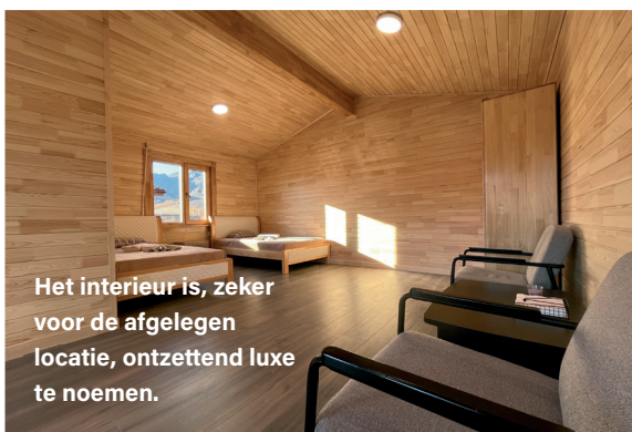
Het interieur is, zeker voor de afgelegen locatie, ontzettend luxe te noemen.

bij grote groepen vee. Ik spot zelfs een wolf en dat is goed nieuws volgens Davaa: wolven brengen geluk! We genieten met volle teugen, wat is het hier mooi. Na een goede lunch in Erdenet gaan we 's middags off road en zoekt de chauffeur de weg langs de heuvels richting de lodge. Als het donker wordt worden we opgewacht door de tweede auto uit de lodge en samen reizen we verder, soms wadend door rivieren en door de modder. Het is een echt avontuur en het is duidelijk dat we zeer afgelegen zijn. In de avond arriveren we bij de lodge die nog in aanbouw is. Henk en ik slapen daarom voor deze trip in een ger, de traditionele tent. En dat is geen straf. Heel erg leuk en luxe ingericht met bedden, tafel, grondzeil en gezellige houtkachel. We eten wat en gaan slapen. De lodge ligt aan de rivier, we hebben natuurlijk al snel even gekeken en morgen bij het eerste licht gaan we gelijk vissen!