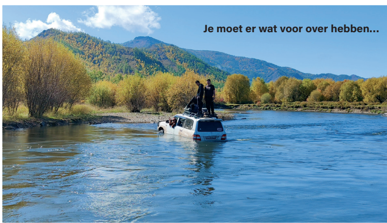
Je moet er wat voor over hebben...

De natuur is overweldigend mooi, helemaal omdat in een paar dagen tijd de herfstkleuren er volledig uit gekomen zijn. Met een half zonnetje erbij is het echt fantastisch mooi! De verkenning werpt zijn vruchten af; deze plek is lastig te bevissen. De rivier is net te diep om met een waadpak over te steken en de oever waar we aankomen is niet geschikt omdat hier meer mensen zijn; locals die natuurlijk ook vissen. We besluiten daarom terug te keren via een andere route en in de middag rond het kamp nogmaals ons geluk te