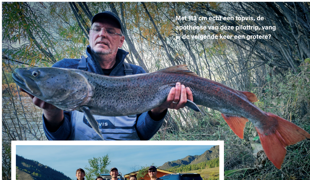
Met 113 cm echt een topvis, de apotheose van deze pilottrip, vang jij de volgende keer een grotere?