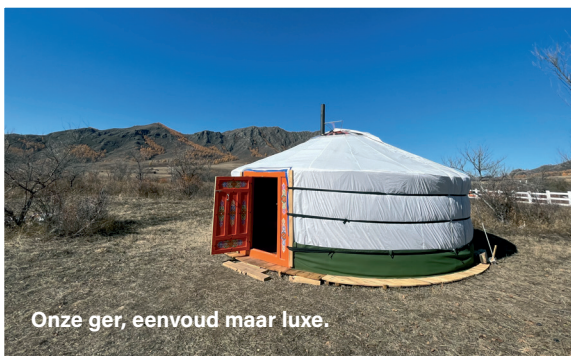
Onze ger, eenvoudig maar luxe.