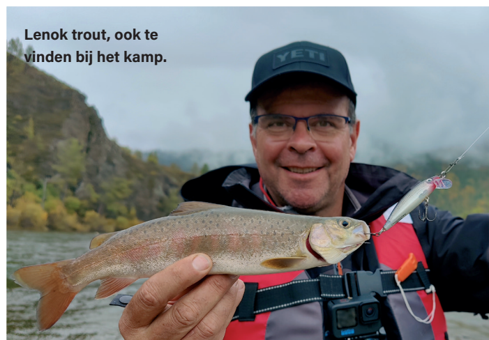
Lenok trout, ook te vinden bij het kamp.

We besluiten daarom opnieuw met de boot te gaan en de rivier verder te verkennen. En ook om te proberen lenok trout en vlagzalm te vangen die hier zouden moeten zwemmen. Dit proberen we in de hardere stroomversnellingen rond de zandbanken en naast twee kleine taimen die we vangen lukt het mij om ook een drietal lenok trouts te vangen, erg gaaf. Toch is dit vissen op lenok trout niet wild en omdat de rivier hard stroomt en de terugreis daarom lang wordt besluiten we terug te gaan. We hebben genoeg gezien om te weten dat het vissen met een boot langs de rivier succesvol kan zijn en dat er vis te vangen valt. Later bij het kamp weet Henk nog een lenok trout te vangen en kan ook hij deze 'afstrepen'.