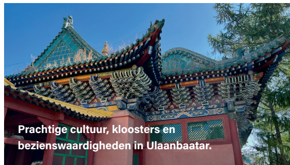
Prachtige cultuur, kloosters en bezienswaardigheden in Ulaanbaatar.