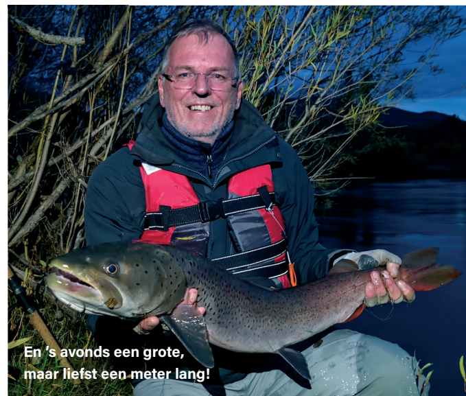
En 's avonds een grote, maar liefst een meter lang!