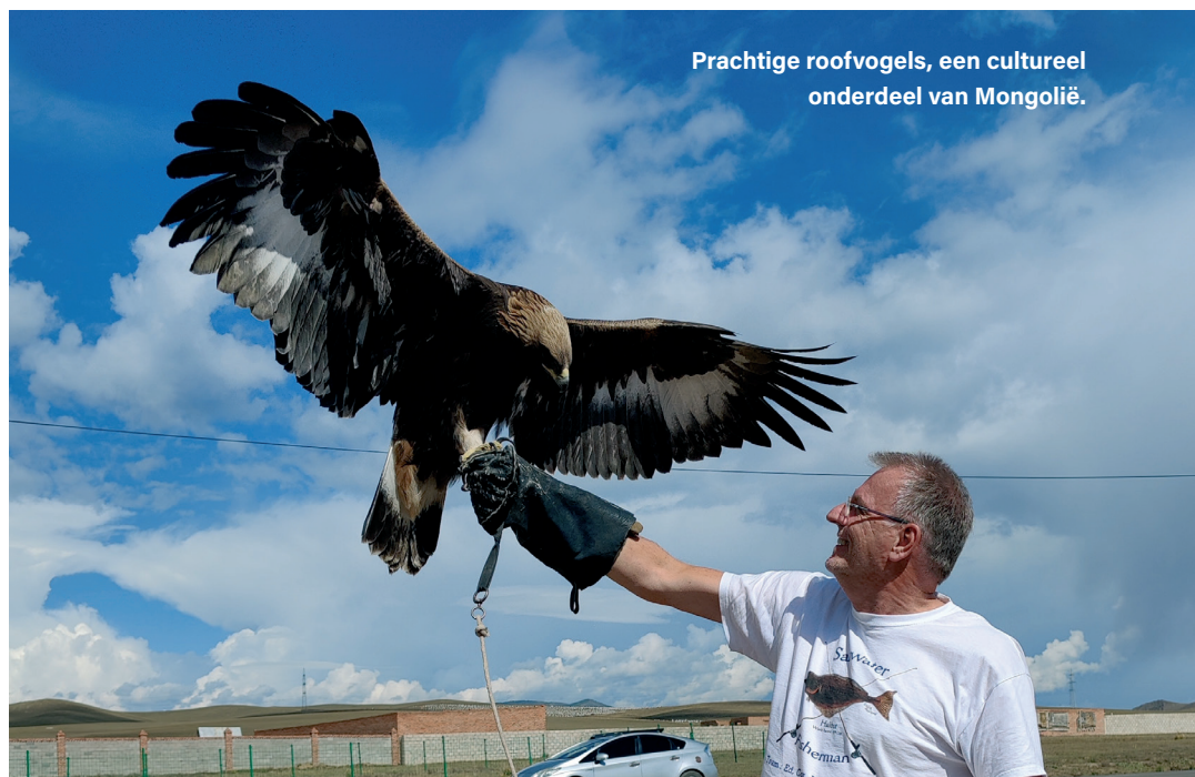
Prachtige roofvogels, een cultureel onderdeel van Mongolië.

De volgende ochtend vertrekken we vroeg en verlaten we Ulaanbaatar. Al snel verdwijnen de huizen en wordt het landschap weidser, mooier, indrukwekkender. We zien overal de bekende tenten met daar-