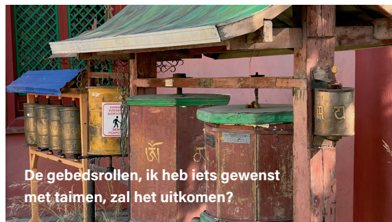
De gebedsrollen, ik heb iets gewenst met taimen, zal het uitkomen?

kloosters leven de monniken die dit geloof dagelijks praktiseren. Het is fantastisch om dit te zien en ons tussen de monniken te bewegen die hun gebeden zingen. In een keer van West Europa in de cultuur van Mongolië; het contrast kan nauwelijks groter zijn. En ook dit maakt dit soort vistrips zo bijzonder, deze prachtige ervaringen! We maken een aantal foto's, lopen langs de gebedsrollen (ik heb iets met taimen gewenst) en gaan daarna door richting de "free market", een enorme open markt waar werkelijk alles te koop is. Hier genieten we van met name de typisch Mongoolse artikelen zoals de fraai vormgegeven zadels voor de Mongoolse paarden en de bijbehorende kleurrijke kleding en laarzen. Het is prachtig.