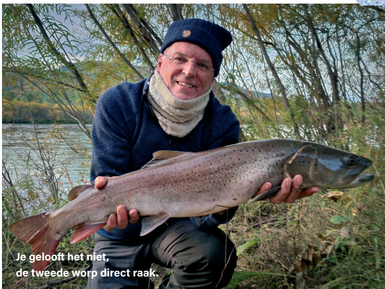
Je gelooft het niet, de tweede worp direct raak.