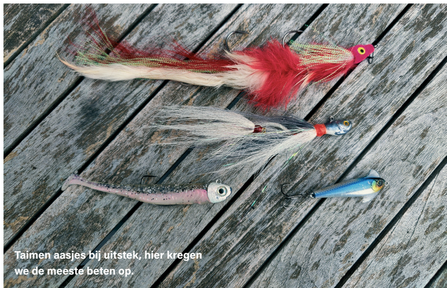
Taimen aasjes bij uitstek, hier kregen we de meeste beten op.

De eerste stop is bij een aantal kloosters. In Mongolië is het boeddhisme het grootste geloof en in de prachtig vormgegeven en gekleurde