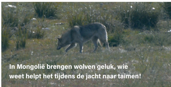
In Mongolië brengen wolven geluk, wie weet helpt het tijdens de jacht naar taimen!