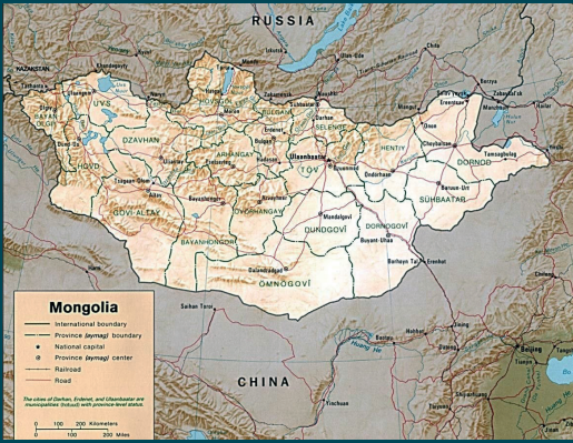
De kaart van Mongolië.

Mongolië is een groot land in Centraal Azië, ingeklemd tussen China en Rusland. Maar hoe groot dan? Groter dan alle landen in west Europa bij elkaar opgeteld! En in dat grote land wonen dan slechts 3,5 miljoen mensen waarvan ongeveer 1,5 miljoen in de hoofdstad Ulaanbataar. Het is daarmee het meest dunbevolkte land ter wereld. Mongolië heeft een heel rijke historie en is één van de machtigste landen ter wereld geweest in de 15de en 16de eeuw. Dit allemaal onder leiding van Dzjengis Khan die ongeveer de hele wereld heeft veroverd! Die trots voel je vandaag de dag nog steeds en veel in Mongolië is opgedragen aan, en vernoemd naar, deze leider.