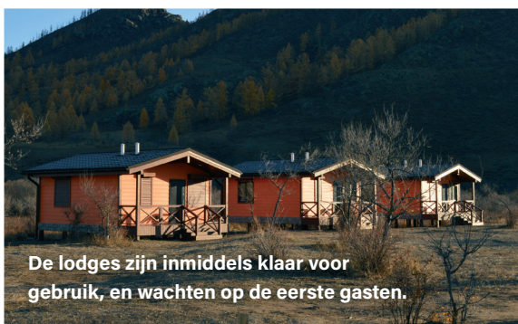
De lodges zijn inmiddels klaar voor gebruik, en wachten op de eerste gasten.