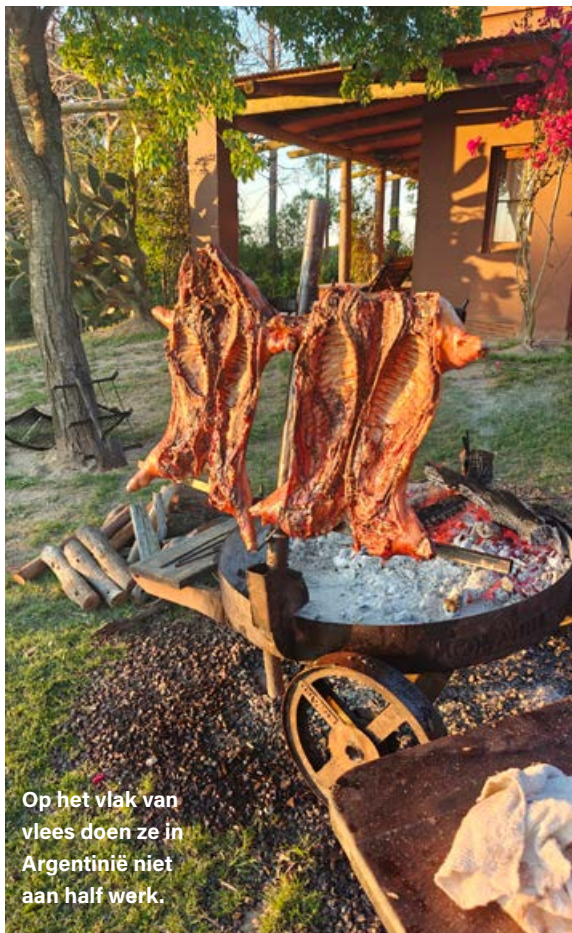
Op het vlak van vlees doen ze in Argentinië niet aan half werk.