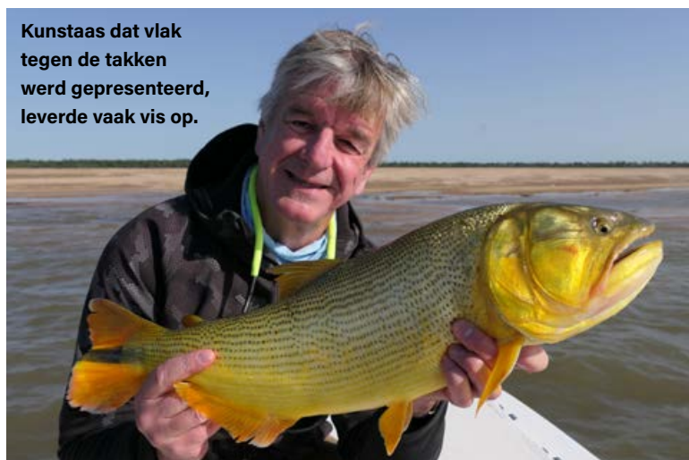
Kunstaas dat vlak tegen de takken werd gepresenteerd, leverde vaak vis op.