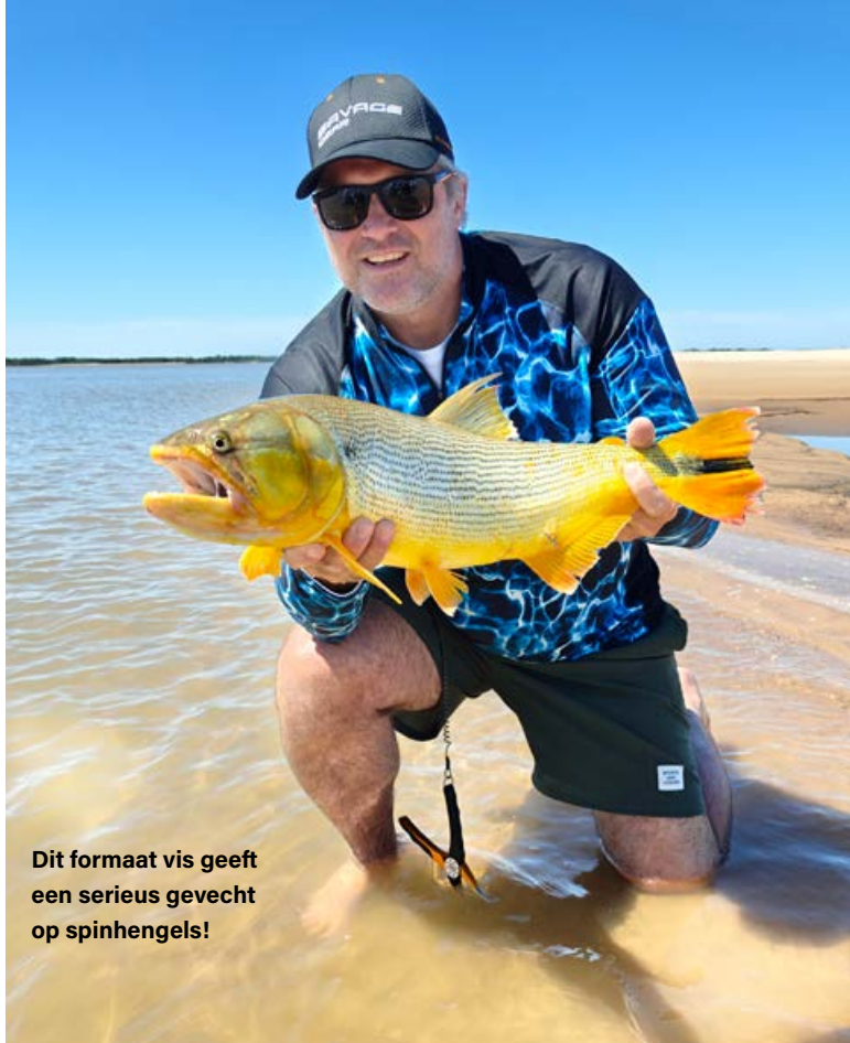
Dit formaat vis geeft een serieus gevecht op spinhengels!

I n Buenos Aires gaan we eerst iets eten in een restaurantje nabij ons hotel. We hebben er een vlucht van 13 uur opzitten, vanuit Schiphol. Op het vliegtuig kregen we een paar keer een typische KLM-maaltijd opgediend en die zijn weliswaar niet perse vies, maar gastronomische hoogstandjes zijn het toch ook weer niet en dus hadden we nog wel 'een hongertje'. Wanneer we het restaurant binnenstappen, zien we een man zitten met een enkel schijfje tomaat op zijn bord, naast een gigantisch stuk vlees. Zo groot dat je er een koe mee kunt doodslaan, wou ik schrijven, als dat niet zo idioot klonk in deze context. Een half uur later hebben we zoveel vlees gegeten dat we amper nog kunnen staan. Dat tomaatje had voor ons niet gehoeven, dat was er te veel aan... Deze culinair best spectaculaire opening van ons Argentijnse avontuur zet zo'n beetje de toon voor de hele week: we worden verwend met veel, heel veel vlees. Wanneer de kok in