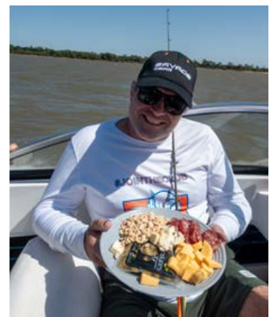
Op en top genieten aan boord van ms Dorado Fever...