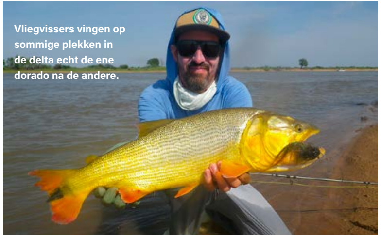
Vliegvissers vingen op sommige plekken in de delta echt de ene dorado na de andere.