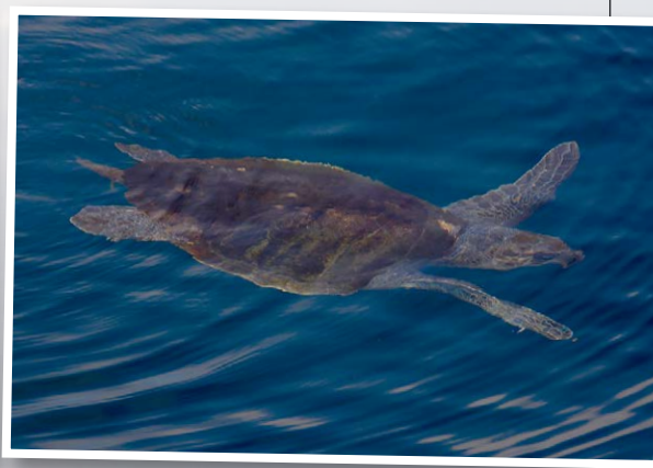
Een beleving an sich: we zien schildpadden en hebben meerdere ontmoetingen met walvishaaien.

het feit dat deze bestemming door iedereen bevestigd kan worden. Voor iedereen is er wel een visserij en techniek die past en je hoeft echt geen supergetraind lijf te hebben om dit vol te houden. Ik beschouw de pilottrip daarom als geslaagd en ik hoop dat velen dezelfde ervaring mogen beleven zoals wij dit deze week hebben gehad. Dit lijstje met Colombia is prima bevallen!