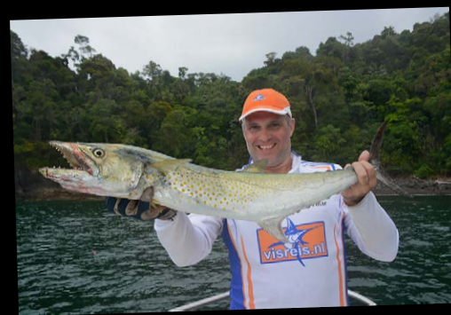
Ook de sierra mackerel konden we op ons lijstje afvinken.