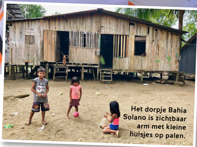
Het dorpje Bahia Solano is zichtbaar arm met kleine huisjes op palen.

Wat een vis en wat een omgeving! De totaalbeleving maakt deze trip tot een unieke ervaring!