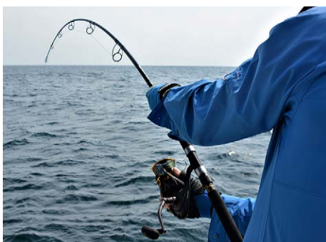
Molens met een hoge slipkracht zijn nodig.