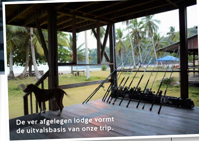
De ver afgelegen lodge vormt de uitvalsbasis van onze trip.

paar uur zit je aan de andere kant van de wereld in een lekker temperatuurtje van een lekker biertje te genieten. Terwijl thuis de temperaturen onder nul zijn gedoken en iedereen binnen leeft. De volgende ochtend begint deel twee van