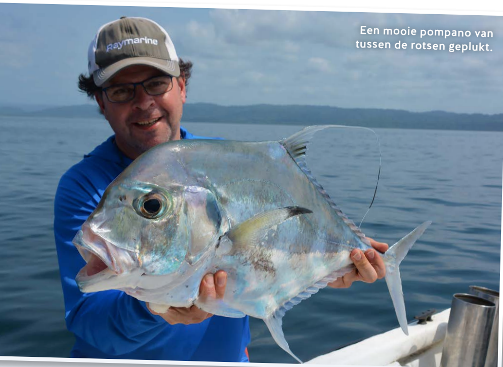
Een mooie pompano van tussen de rotsen geplukt.

Wat een kracht! Met een DOORGE- SCHUURDE LIJN blijf ik verbouwereerd staan.