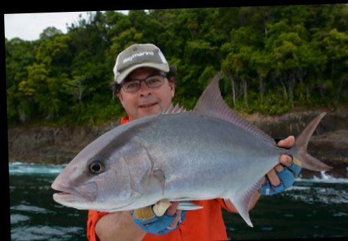
De Almaco jack is familie van de amberjack en de yellowtail.