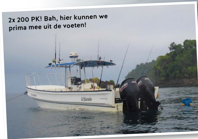
2x 200 PK! Bah, hier kunnen we prima mee uit de voeten!

De reis naar de bestemming is een belevenis op zich. Vanaf Schiphol reizen